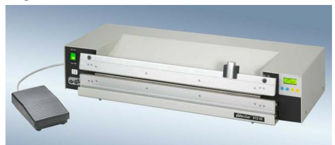
polystar® 613 M mit Schneidvorrichtung