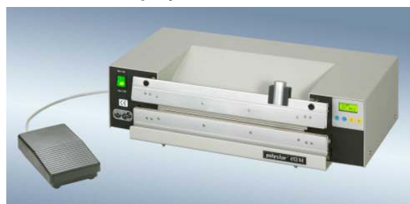
polystar® 413 M mit Schneidvorrichtung